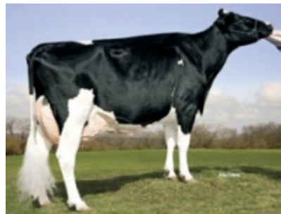
> Kamps-Hollow Altitude-ET (grand-mère)