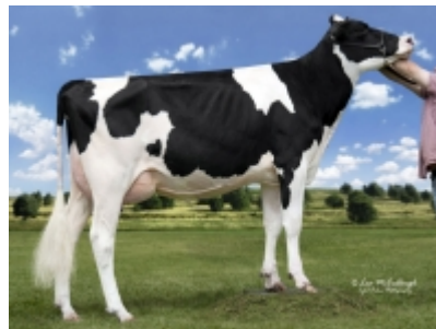
> Far-R-La Atwood Angelie-ET (mère)